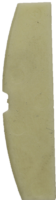
Lámina de rotor